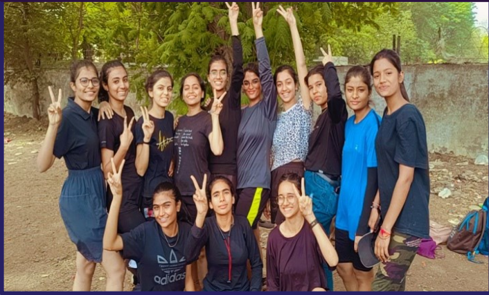
Kho-Kho Team- Winners