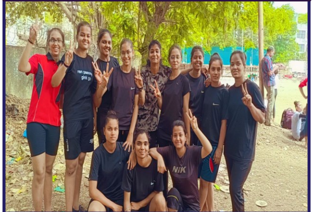
Kho-Kho Team- Runners up