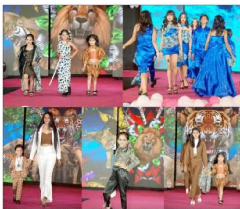
વનિતા વિશ્રામ વિમેન્સ યુનિવર્સિટી ખાતે ફેશન શો 'શ્રીઝન' સીઝન-૩ યોજાયો હતો જેમાં સંસ્થાની ૪૮ મોડેલો અને ગ્રેવિટ ફેશનના ૩૨ બાળકોએ રેમ્પ વોક કર્યું હતું.

સુરત. વનિતા વિશ્રામ વિશ્વવિદ્યાલય મેં ગુરુવાર કો ફેશન ડિઝાઇનિંગ કી છાત્રાઓં ને તૈયાર કિએ પરિધાનોં કો ફેશન શો કે જરિએ પ્રદર્શિત કિયા ગયા. ઇસ દૌરાન બચ્ચોં કે લિએ જંગલ બુક થીમ પર ગારમેન્ટસ તૈયાર કિએ થે, જિન્હેં પહનકર બચ્ચોં ને રેમ્પવૉક કર સમી કો લુખાયા।